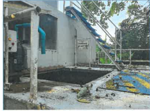
ระบบคลอรีน