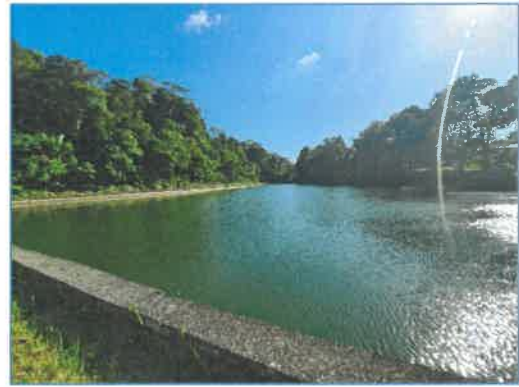
แหล่งน้ำดิบของโครงการ