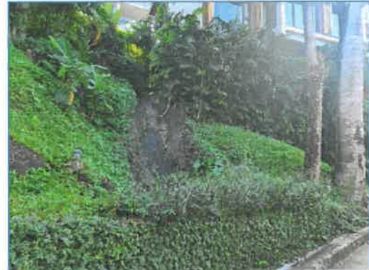
ระบบระบายน้ำฝน