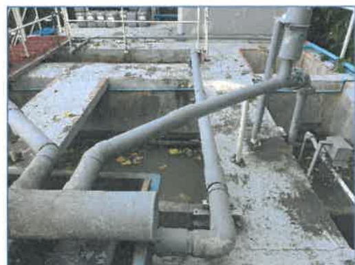
ระบบบำบัดน้ำเสีย