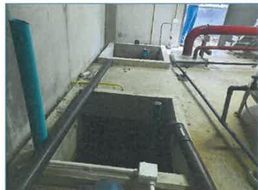
ถังเก็บน้ำใช้