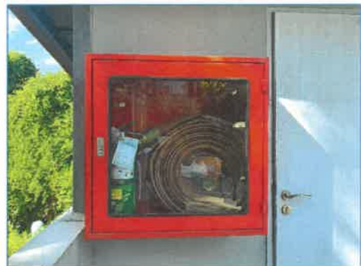
ระบบแจ้งเตือนอัคคีภัยและป้องกันอัคคีภัยภายในโครงการ