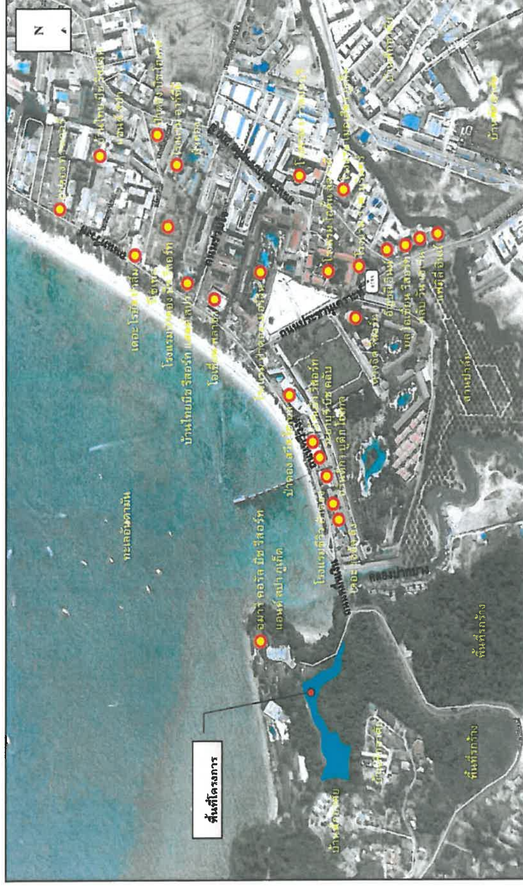
ที่มา : รายงานการศึกษาผลกระทบสิ่งแวดล้อมเบื้องต้น ฉบับสมบูรณ์ โครงการ อมรี เรสซิเดนซ์ ภูเก็ต, มกราคม 2555

บริษัท เกิดเอ็นเวรคอมเพทอล เซอร์วิส จำกัด จัดทำโดย