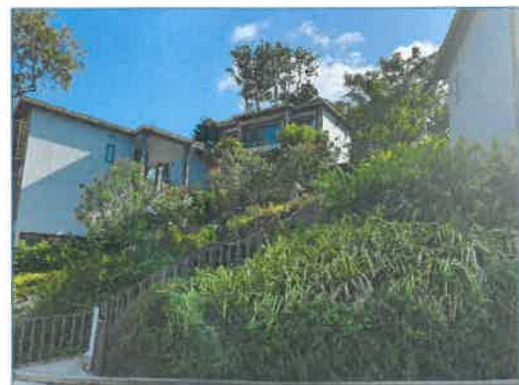
พื้นที่สีเขียวของโครงการ