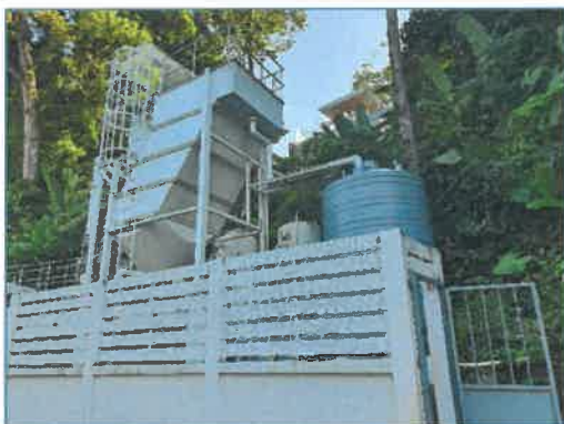
อาคารปรับปรุงคุณภาพน้ำ

โครงการจัดให้มีระบบปรับปรุงคุณภาพน้ำใช้ เพื่อปรับค่าความเป็นกรดเป็นด่างให้อยู่ในเกณฑ์ มาตรฐาน และจัดให้มีถังเก็บน้ำใต้ดิน จำนวน 1 ถัง ปริมาตร 450 ลูกบาศก์เมตร